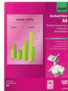
LF 620 für Farb-Laser/-Kopierer