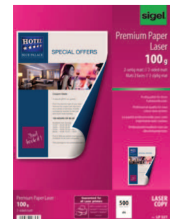
LP321 für Farb-Laser/-Kopierer