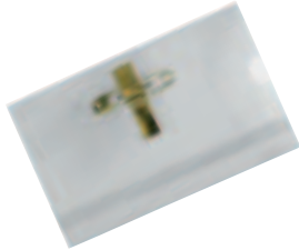
Namensschilder mit Kombiklemme