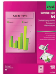
LF 620 für Farb-Laser/-Kopierer