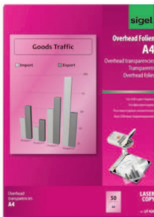
LF 420 für S/W-Laser/-Kopierer

Die transparenten, spezialbeschichteten Overhead-Folien für Laser und -Kopierer im Format DIN A4 sind beidseitig bedruckbar und dank sekundenschneller Trocknung sofort einsatzbereit. Hohe Hitzestabilität. Die Folie ist stapelverarbeitbar und kann über den Sammelschacht des Druckers eingezogen werden.