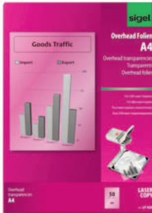
LF 420 für S/W-Laser/-Kopierer

Die transparenten, spezialbeschichteten Overhead-Folien für Laser und -Kopierer im Format DIN A4 sind beidseitig bedruckbar und dank sekundenschneller Trocknung sofort einsatzbereit. Hohe Hitzestabilität. Die Folie ist stapelverarbeitbar und kann über den Sammelschacht des Druckers eingezogen werden.