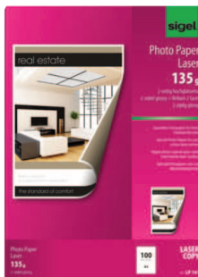
LP141 für Farb-Laser/-Kopierer

Das Foto- und Premiumpapier ist ideal für hochwertige beidseitige Ausdrücke von Fotos, Grafiken und Texten. Es liefert brillante Farben, gestochen scharfe Texte und detailgenaue Grafiken.